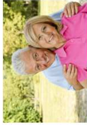
SAÚDE INDIVIDUAL OU FAMILIAR