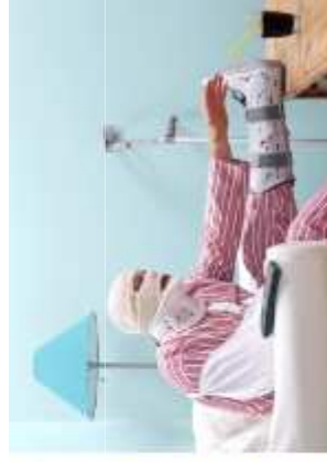
ACIDENTE PESSOAL INDIV